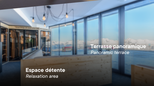
Terrasse panoramique Panoramic terrace