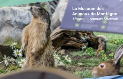
Le Muséum des Animaux de Montagne Mountain Animals Museum

VALLANDRY, UN LIEU UNIQUE AUX MULTIPLES FACETTES VALLANDRY, A UNIQUE MULTIFACETED SPACE Le nouvel espace incontournable du domaine. The resort's new must-see area. En accès libre / Free access